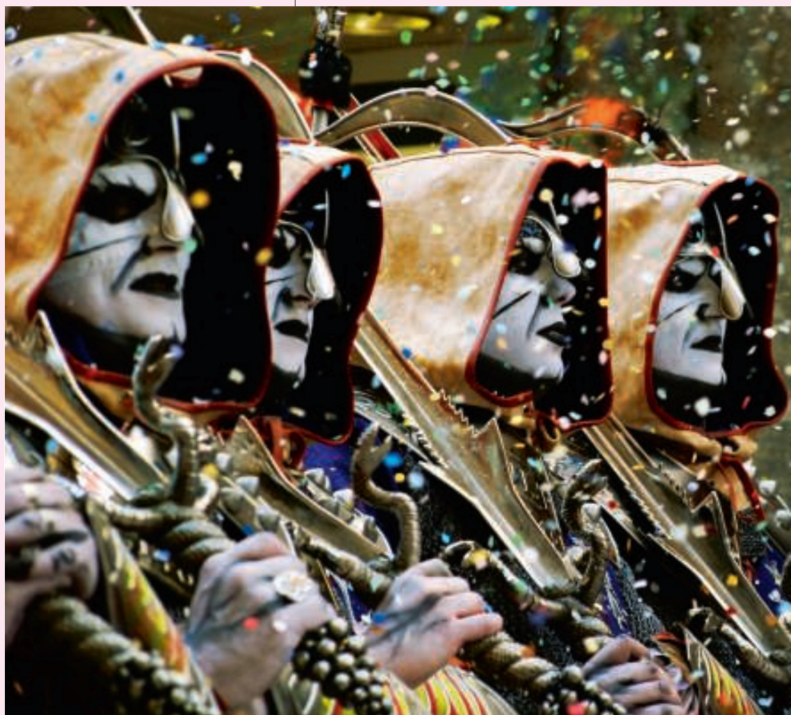
Op zondag wordt in een kleurrijke processie Joris de Morendoder geëerd.

‘Joris is onze beschermheilige,’ zegt Paolo. Ze is behulpzaam maar ze wan-