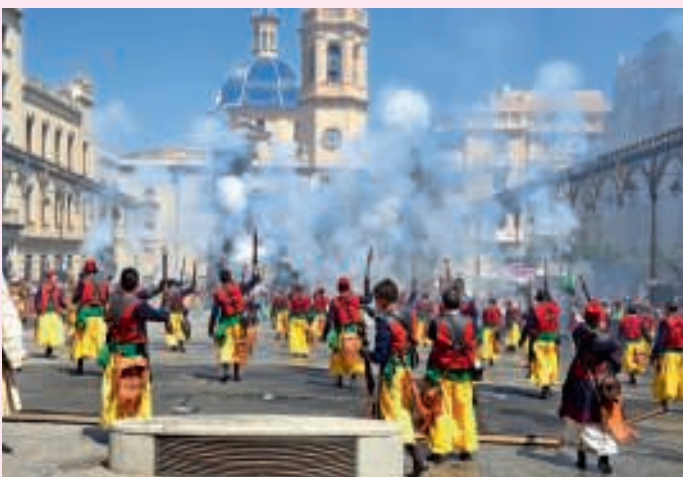
De stormloop op de Plaza España

hammed niet meer van de kantelen van het kasteel zoals vroeger. Maar dit festival is een eeuwenoude traditie. Die laten wij ons niet afnemen.’ Een lange brug, vernoemd naar Sant Jordi, leidt over een ravijn naar het Plaza España. Het is de enige toe-