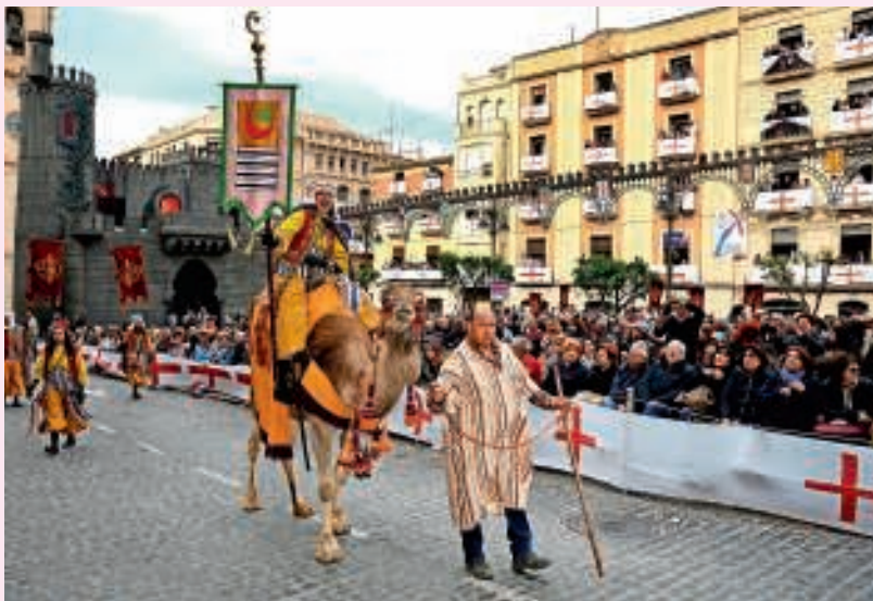
Optocht met ridders te paard of op dromedarissen.

‘Wij hebben respect voor de moslims. Wij hebben ons verdiept in hun cultuur