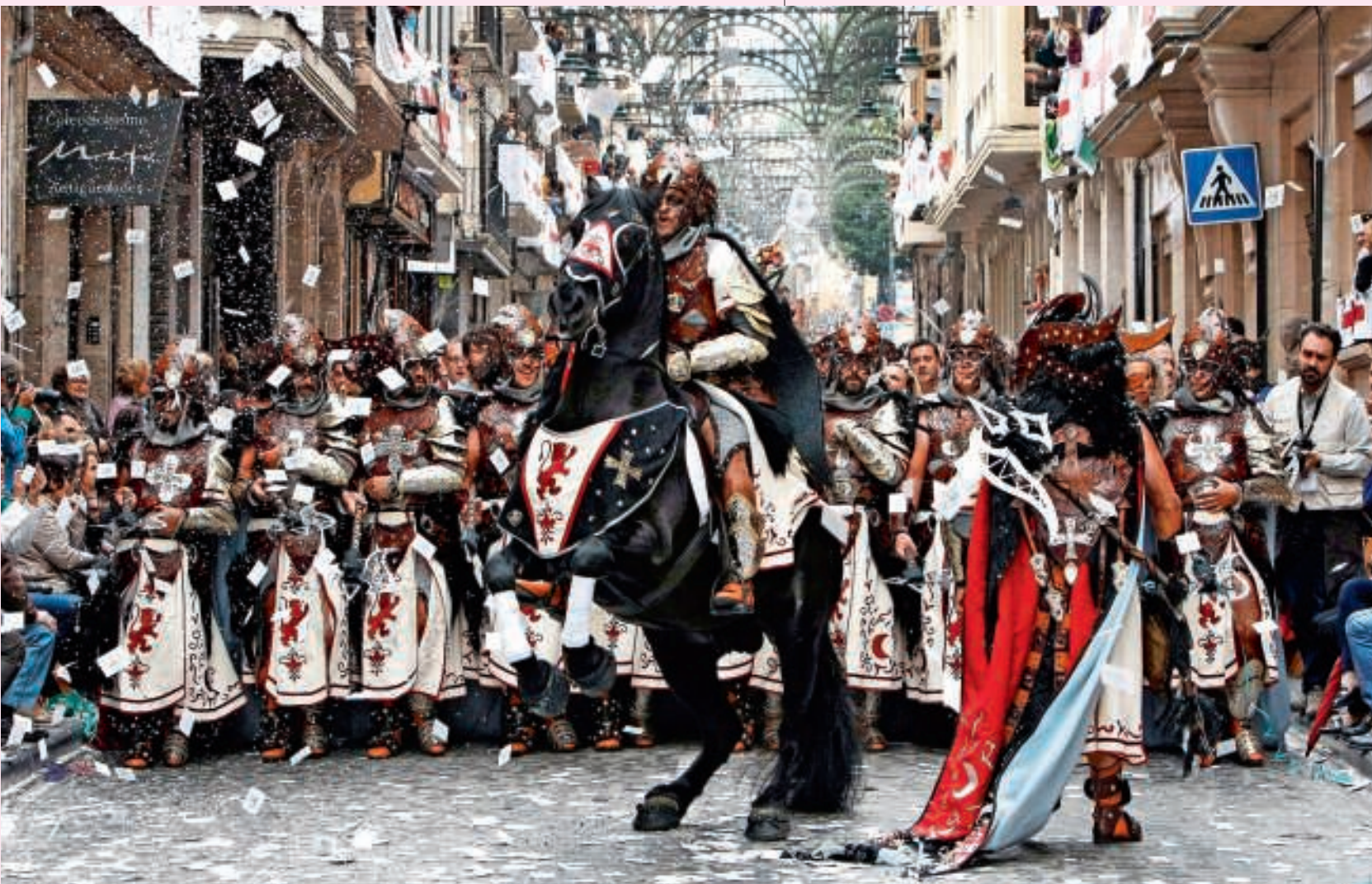
De christenen winnen ieder jaar weer in Alcoy.

'Bewoners van Alcoy, christenen!', antwoordt de christelijke koning. 'Verdedig de stad ter ere van de heilige Joris, van Aragón en het geloof in Jezus Christus.' Honderden christelijke ridders verzamelen zich rond het kasteel. Harnassen en helmen, zwaarden en hellebaarden glinsteren in de lentezon. De strijd kan beginnen.