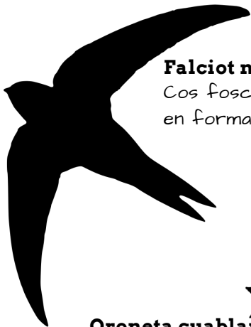
Falciot negre ( Apus apus ).

Fixa't que durant aquestos dies sobrevolen per la teua finestra de forma incansable pardals com aquests. Es tracta d'aus gregaries que s'alimenten d'insectes voladors que cacen al vol. T'abelleix aprendre a distingir-los?